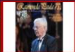
RAINONDA RŪJULA 75. JUBILEJAS KONCERTS VIDEOFORMĀTĀ (DVD, 2011)