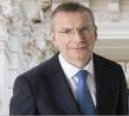
LATVIJAS VALSTS 11. PREZIDENTS EDGARS RINKĒVIČS (1973- ...)