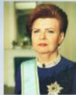
VAIRA VĪĶE-FREIBERGA - LATVIJAS VALSTS 6. PREZIDENTE (1937 - ....)