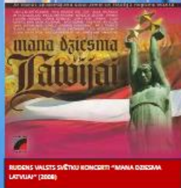
BUIDENS VALSTS SVĒTKU KONCERTI "MANA DZIESMA LATVIJAI" (2006)