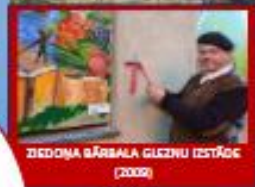
ZIEDONA BĀRBALA GLEZNU IZSTĀDE (2009)