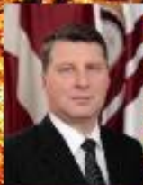
RAIMONDS VĒJONIS - 9. LATVIJAS PREZIDENTS