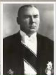
LATVIJAS VALSTS 3.PREZIDENTS Alberts Kviesis (1881-1944)

1. "Visas mūsu sirdis un domas, jūtas un prāts, mūsu dzīve un darbs pieder tēvzemei un brīvībai. Vārdiem, kas iekalti pieminēklī."