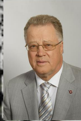
Guntis Ulmanis - Latvijas Valsts 5. prezidents (1939 - ....)

"... Etniskās un kultūras vērtības ir vienas no pašām augstākajām vērtībām Eiropā un tātad arī Latvijā."