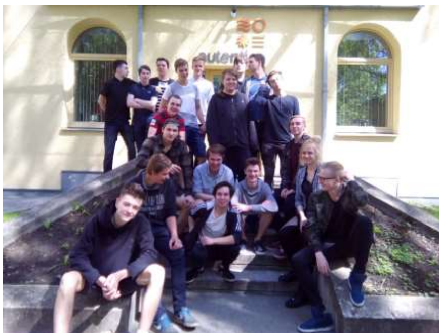
10.05.2018. P1-2 grupa uzņēmuma "Autentica" meistarklasē "Ievads MVC programmēšanā mazu un vidēju lielu sistēmu izstrādē".